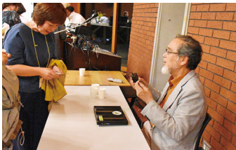
いつもは200名が集うホールも、今年は半分の100名となります。